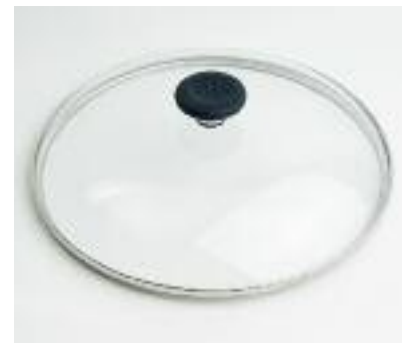
Glasdeckel für GKST 75 Z2 Vital