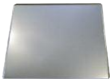
Backblech für PX 790