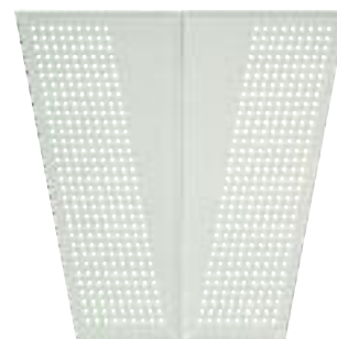
Glasschneidebrett für GKST 52-32 DB Select