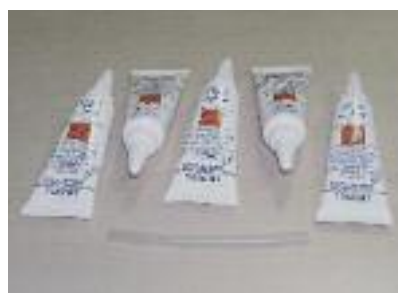
Reinigung-Set für PX 790