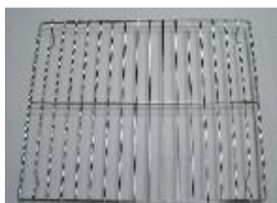
Rost für PX 790