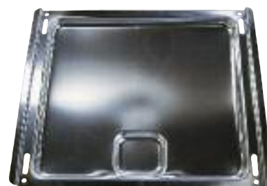
Multifunktions-Pfanne für PX 790