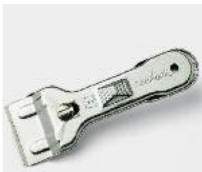
Reinigungsschaber für alle Glaskeramik-Kochfelder