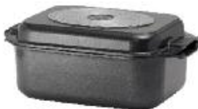
Induktions-Bräter mit Deckel, 25 x 41,5 cm