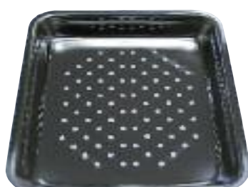
Gemüseinsatz für PX 790