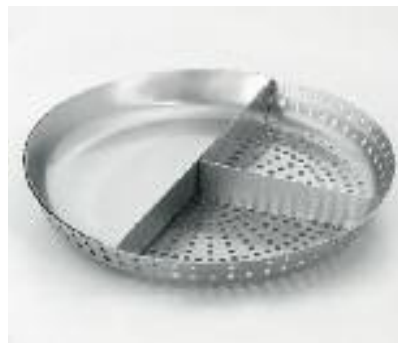
Dampfgareinsatz für GKST 75 Z2 Vital