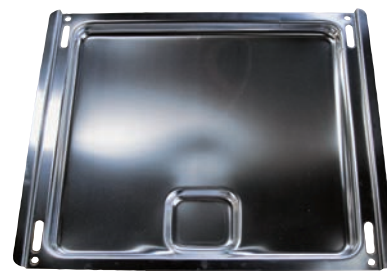
Multifunktions-Pfanne für PX 790