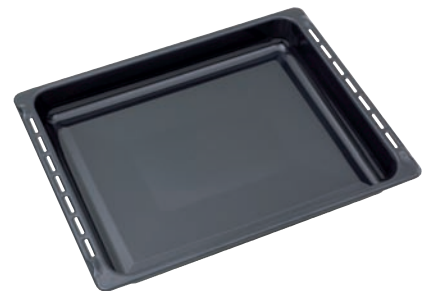
Multifunktions-Pfanne emailliert, grau