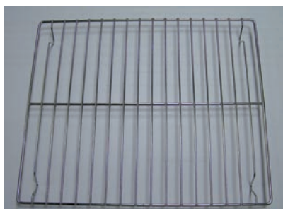
Rost für PX 790