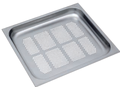
Gareinsatz 40 mm für HK 930 S, HKX 930 S