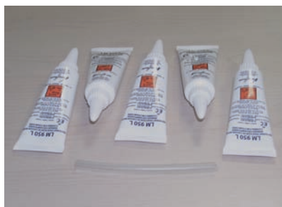
Reinigung-Set für PX 790