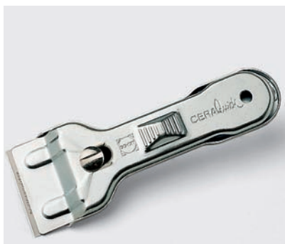
Reinigungsschaber für alle Glaskeramik-Kochfelder