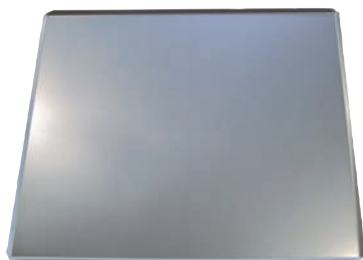
Backblech für PX 790