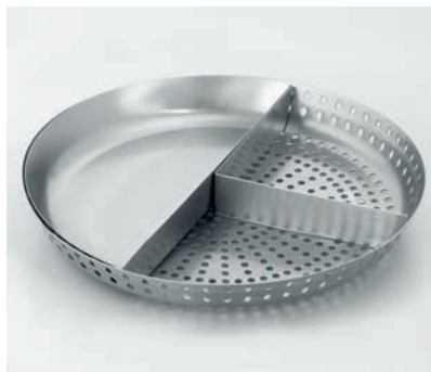
Dampfgareinsatz für GKST 75 Z2 Vital