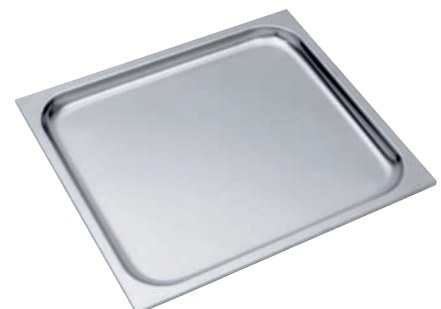
Gareinsatz 20 mm für HK 930 S, HKX 930 S