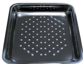
Gemüseinsatz für PX 790