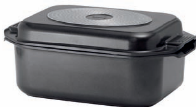
Induktions-Bräter mit Deckel, 25 x 41,5 cm