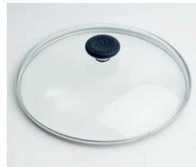
Glasdeckel für GKST 75 Z2 Vital